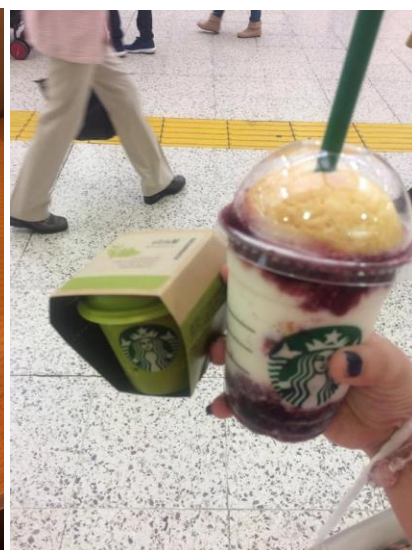
สตาร์บัคที่ออกในช่วงนั้น