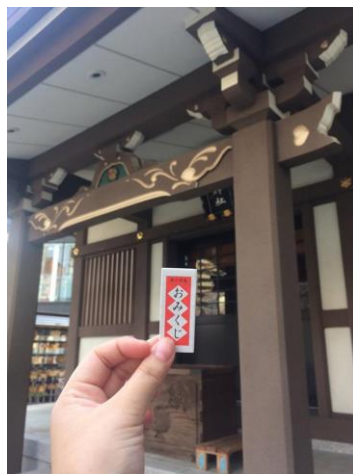
ไปศาลเจ้า