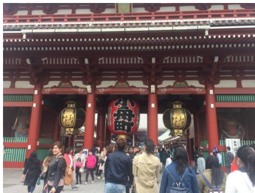
วัดเซนโซจิ