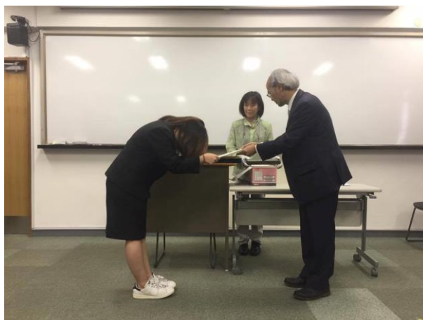
รับใบจบจากครูใหญ่