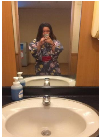
ได้ไปออนเซ็น

5 วันสุดท้ายคือการ ไปหลายๆที่ซื้อของหลายๆอย่าง เป็นการเก็บตกก่อนกลับ