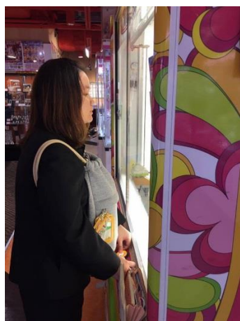
ใช้เวลาและเงิน ไปกับเกมส์เซ็นเตอร์เป็นส่วนใหญ่