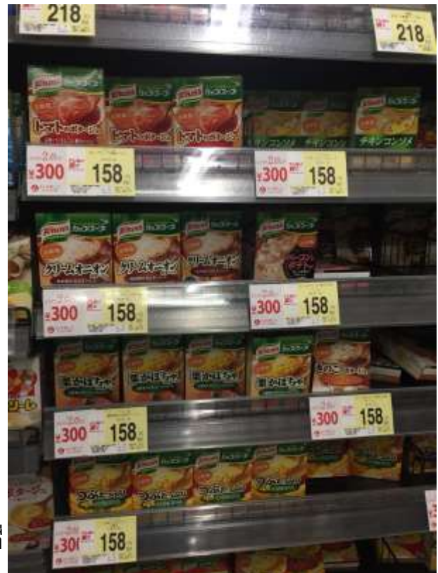
เที่ยวที่